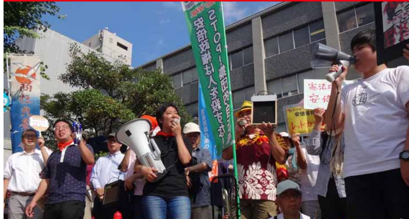
7/1 首相官邸前行動に1万人を超える人々が参加。「安倍を倒そう！」と朝から深夜まで声をあげた

世界で人を殺すな！ 集団的自衛権・閣議決定撤回を！ 戦争につながる一切を拒否！ 辺野古新基地建設阻止！ 希望者みなに放射能健康診断を！ すべての原発廃炉だ 派遣永久化・首切り自由にNO！